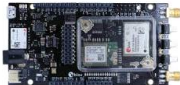
<그림. Ublox 사의 F9P 평가보드>

① Ublox 사의 F9X 엔진을 이용한 GPS 모듈, 보정신호수신기능 없음.