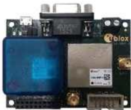
<그림 Ublox사의 M8P 보드>

② Ublox 사의 M8X 엔진을 이용한 GPS 모듈, 보정신호수신기능 없다.