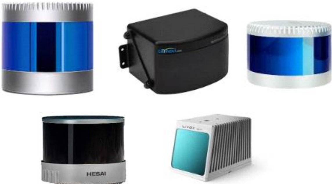
<그림 기타 라이다 제품류 초당 300,000포인트 이하 제품>

제 19 조 (카메라 제품) 본 대회에 참가하는 차량에 카메라에 대한 제한은 없다. 크기 및 해상도 인터페이스 방식에 상관없이 카메라를 활용할 수 있다. 단 컨트롤러가 내장되어 영상처리 소프트웨어와 AT 소프트웨어를 탑재할 수 있는 스마트 카메라는 사용할 수 없다.