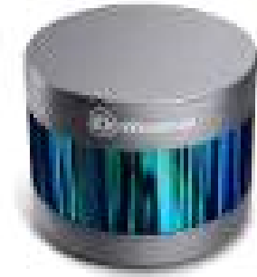
<그림 ROBOSENSE RS-Lidar-16 제품>