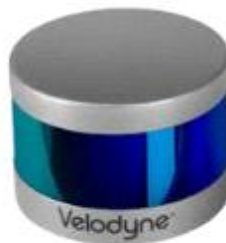
<그림 벨로다인사의 VLP-16>