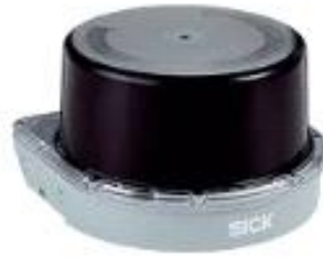
<그림 SICK 사의 3D 라이다>