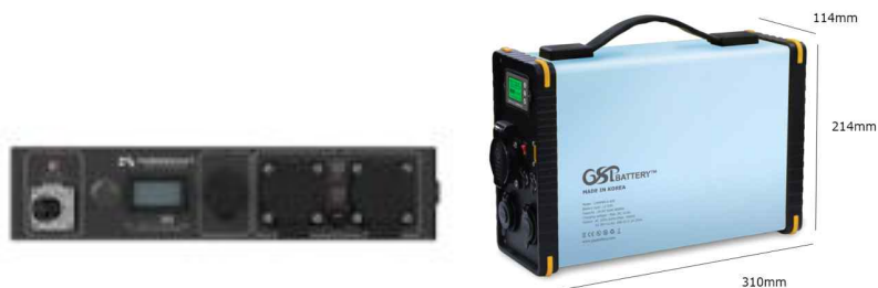
<그림 추가 사용 가능한 배터리 팩 (디바이스몰, GSP몰 제품)>

제 21 조 (추가 배터리 사용) 본 대회에 참가하는 차량은 차량의 구동에 활용하는 배터리 이외에 자율주행을 위한 센서와 컨트롤러를 위해 별도의 배터리를 사용할 수 있다. 별도의 배터리의 총 용량은 600Wh 이하이며 인버터의 최대 용량은 600W를 초과할 수 없다. (예 리튬이온전지 12V 50A 이하의 배터리)