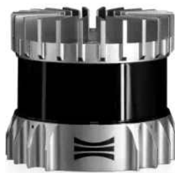
<그림 OUSTER OS0 제품>