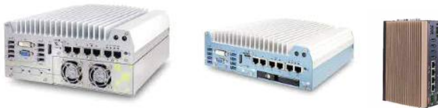
<그림 본 대회에서 활용 가능한 컨트롤러 예(Neosys사 제품)>

제 20 조 (컨트롤러) 센서의 데이터 처리 및 자율주행 소프트웨어의 구현을 위하여 사용하는 컨트롤러에 대한 제한은 없다. 단 차량의 주행에 영향을 미칠 정도로 큰 크기의 컨트롤러는 사용할 수 없다. GPU가 장착된 컨트롤러도 활용할 수 있으며 이를 위한 별도의 전원을 활용할 수 있으나 제 21조에 제시된 용량을 벗어난 배터리를 사용할 수 없다.