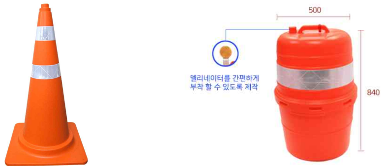
<그림 본 대회에서 활용하는 정적 장애물>