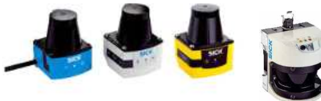
<그림 SICK사의 2D 라이더>