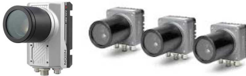
<그림 본 대회에 사용할 수 없는 스마트카메라 종류(ADLink, NI 사 제품)>

제 20 조 (컨트롤러) 센서의 데이터 처리 및 자율주행 소프트웨어의 구현을 위하여 사용하는 컨트롤러에 대한 제한은 없다. 단 차량의 주행에 영향을 미칠 정도로 큰 크기의 컨트롤러는 사용할 수 없다. GPU가 장착된 컨트롤러도 활용할 수 있으며 이를 위한 별도의 전원을 활용할 수 있으나 제 21조에 제시된 용량을 벗어난 배터리를 사용할 수 없다.