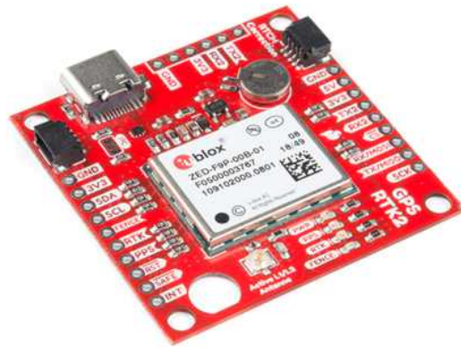
<그림 Sparkfun사의 F9P 보드>