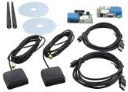
<그림 Ublox사의 M8P RTK 보드>