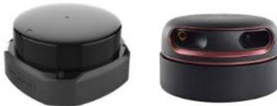
<그림 SLAMTEC 2D 라이다 제품>