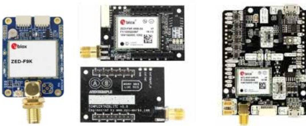
<그림 기타 Ublox F9X 엔진을 사용한 GPS 모듈>

제 18 조 (Lidar) 본 대회에서 허용하는 라이더는 2D Lidar 1개, 3D Lidar 1개로 3D Lidar를 기준으로 초당 300,000 point 이하의 제품을 사용하는 것을 허용한다. 3D Lidar 구입가격 기준으로 600만원 이하의 제품을 사용해야 한다.