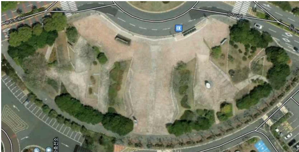
<그림 본 대회 개최 장소>